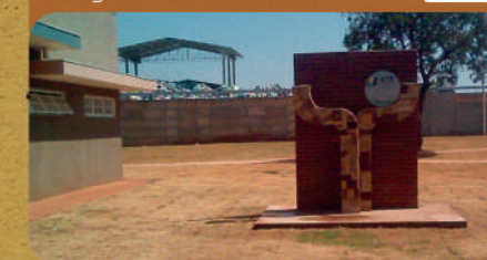
Fachada da Unidade de Triagem de Resíduos