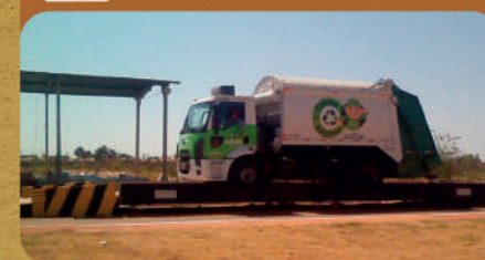
Pesagem do caminhão com os resíduos recicláveis