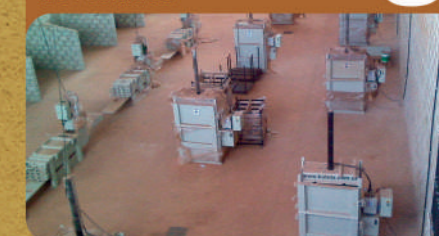
Local de prensagem de resíduos