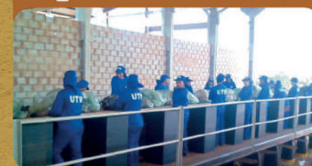
Trabalhadores das cooperativas de catadores nas esteiras de triagem