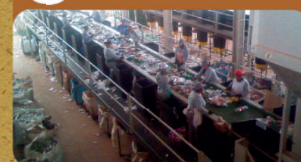
Equipe de Cooperados